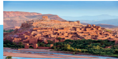
Deserto di Merzouga